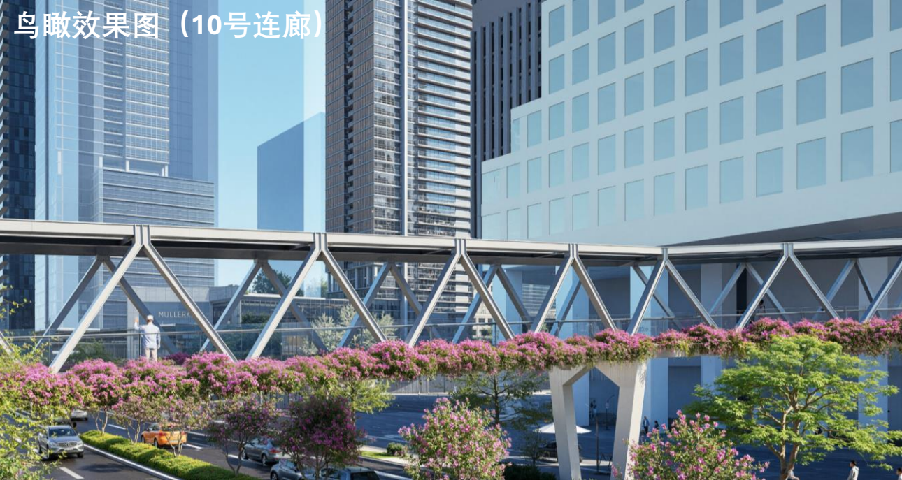
鸟瞰效果图（10号连廊）