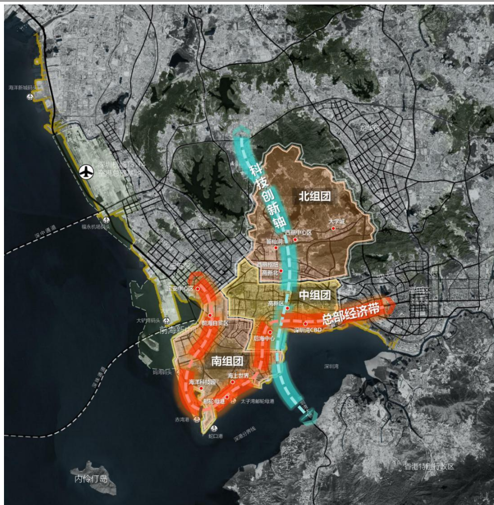
专栏 3：“一轴一带三组团”发展格局示意图

和活力的湾区总部经济带。 三组团 ：北部、中部和南部三大组团，北部组团涵盖西丽、桃源街道，以西丽湖国际科教城、西丽高铁新城为重点，打造集科研教育、高铁枢纽、生态涵养于一体的协调发展示范片区；中部组团涵盖粤海、沙河、南头街道，以高新区、华侨城片区、南头古城为重点，打造集高新技术、文化创意、文脉传承于一体的创新发展示范片区；南部组团涵盖南山、蛇口、招商街道，以前海、蛇口国际海洋城为重点，打造集深港合作、海洋经济、国际交往于一体的开放发展示范片区。