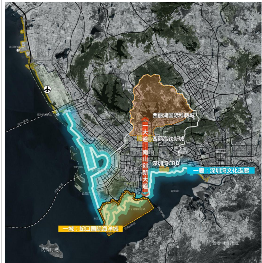
专栏5：新时代“3+3”战略示范工程示意图

立体复合的“城市创新脊梁”，成为产学研用深度融合发展、地上地下空间综合开发、生产生活生态协同发展、高密度建成区智慧高效安全运行的综合示范平台，打造全球科技产业创新中心的“星光大道”。